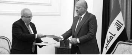
وعاصمتها القدس الشريف. عقد اللجنة المشتركة في أواخر شهر نوفمبر

بغداد ملتزمة بإنجاح القمة العربية بالجزائر