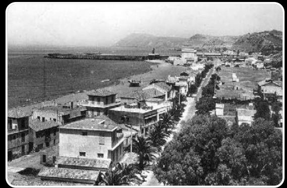
مدينة عين تموشنت