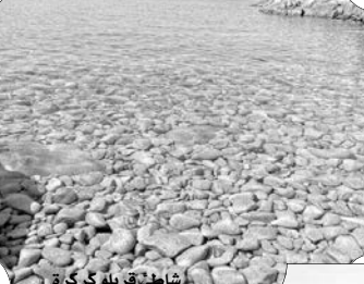
شاطئ قريلو كركرة

مختلف الدواسات أو الدراجات المائية، كما طلبت من أصحاب قوارب النزهة والدراجات المائية والمسافة الآمنة المائية (كايك)، بضرورة احترام المسافة الآمنة والمقدرة بحوالي 300 متر عن الشاطئ، فيما نصحت الأولياء بمراقبة أولادهم أثناء السباحة. ويأتي نداء الحماية المدنية، في الوقت الذي شهدت فيه شواطئ سكيكدة منذ انطلاق الموسم الصيفي الحالي، عدة حوادث خطيرة ناجمة عن عدم التزام المصطافين خصوصاً القادمين من الولايات الداخلية، بالإجراءات الوقائية الضرورية كاحترام الإشارات والنشرات الخاصة بأحوال البحر واختيار الشواطئ الممنوعة والصخرية.