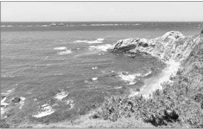
شاطئ بقبية بالقل