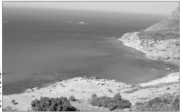
شاطئ رأس الحديد الورس