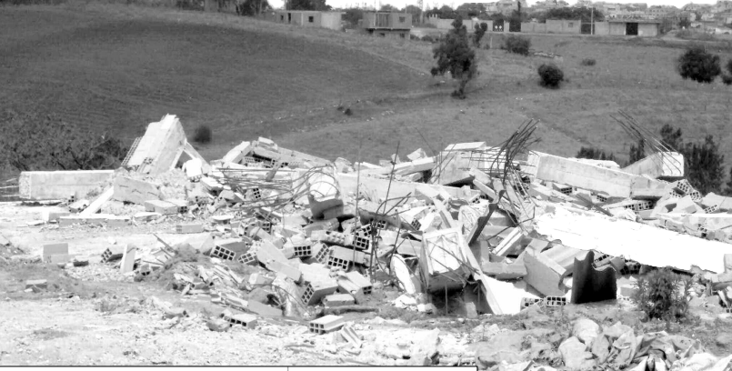
بنايات فوضوية بالخراسية