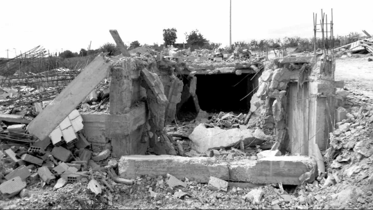
أحد البنايات التي تم هدمها بمشيرة بحبي شرشالي بوعلام بالخراسية