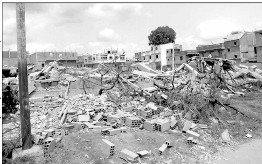
أحد البنايات التي تم هدمها بمشيرة بحبي شرشالي بوعلام بالخراسية

إلى أن 12 حالة تعرضت للهدم الأسبوع الماضي وأن العملية ستتمس حالات أخرى أنجزت فوق المستثمرات الفلاحية التي يبلغ عددها 5 مستثمرات، مضافا في هذا الصدد أن هناك لجنة مختصة في مراقبة البنايات الفوضوية على مستوى البلدية سوف لن تتوانى في محاربة هذه الظاهرة التي نشأت في السنوات الأخيرة.