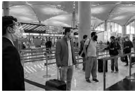
حسب ما ذكرته مروة البنت البكر لصباح.

وتعكس الفنادق الجديدة التي بنيت على شفاف شواطئ البحر بكل من سكيكدة وعتابة وجيجل والقالة الطارف صورة بلد "مريح" وتعطي المزيد من الخيارات لقضاء العطلة الصيفية، حسب رغبات وظروف كل واحد على حد تعبير بعض أفراد الجالية الوطنية المقيمة بالخارج. كما أنّ المساحات الكبرى والأسواق الشعبية وغيرها من الفضاءات التجارية الحديثة المتنوعة بكل من سطيف وقسنطينة تمثل للآخرى أشكال مواقع الترفيه التي تجذب هؤلاء الجزائريين المقيمين بالخارج الذين يفتنمون الفرصة لشراء ما يرغبون فيه. بفضل آخرون التوجه إلى حظائر الترفيه الموجودة عبر ولايات شرق البلاد "صنوبر لاند" والحظيرة المائية "أميرة لاند" التي تم فتحها مؤخرا بالمقاطعة الإدارية على منجلي قسنطينة، ويمثل قضاء العطلة الصيفية بالجزائر كذلك بالنسبة لبعض العائلات فرصة لتعليم أطفالهم اللغة العربية والقرآن الكريم وذلك عبر الأقسام المتنوعة لهذا الغرض بالمساجد.