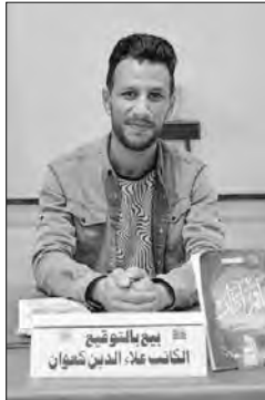
المراد طبعه، بقدر اهتمامها بالجانب التاريخي للملحمة.