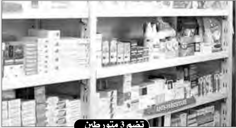
تضم 3 متورطين