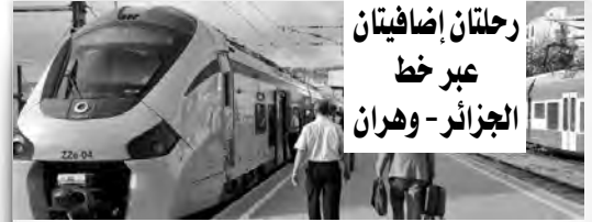
رحلتان إضافيتان عبر خط الجزائر - وهران

أكد وزير النقل، خلال جلسة عمل عقدها أول أمس، بحضور المديرين العامين لمؤسسات النقل التي تشرف على تقديم الخدمة العمومية للمواطنين، ضرورة اتخاذ كافة الإجراءات لضمان دخول اجتماعي سلس يستجيب لتطلعات المواطنين وانشغالهم المتعلقة بمجال النقل، وذلك عن طريق توسيع نطاقه والعناية بنظافته