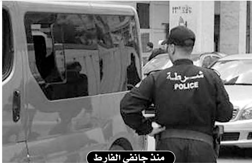
مند جانفي الفارط