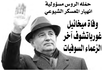
حقله الروس مسؤولية انهيار المعسكر الشيوعي