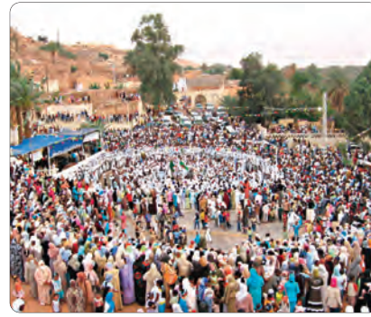
ترافقهم طيلة هذه الإحتفالات بالمولد النبوي الشريف التي تواصل على مدار سبعة أيام.

التي تستجيب لشروط الإقامة والأمن بالمناطق الصحراوية، لتلبية الطلب المعبر عنه من قبل عديد وكالات السياحة والأسفار. وتعود احتفالية المولد النبوي الشريف التقليدية ببني عباس، إلى قرون مضت وتتميز بأجواء روحانية خاصة، وتتضمن عديد مراحل التحضيرات لها من بينها تبويض الأضرحة وغيرها من المعالم الدينية، تقديرا لأرواح شيوخ هذه المنطقة من جنوب غرب البلاد، على غرار مؤسس المدينة سيدي عثمان الغريب، وسمج كرم الضيافة التي يشتهر به السائحون. في التراث ومسؤولي جمعيات محلية بولاية بني عباس.