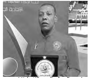
نوه جمال مطر، المدير الفني لمنتخب مصر، والمتوج بلقب أحسن مدرب في البطولة العربية

الثالثة للجمباز، بالمستوى الفني العام للمنافسة، وقال في معرض تقييمه لمخلفاتها ما يلي: "عموما، المستوى الفني للبطولة كان عاليا، بفضل التنافس الشديد من الجمبازيين الجزائريين والأردنيين والقطريين، وأنا متفائل بمستقبل الجمباز العربي، خاصة لدى الناشئين الجزائريين، الذين أبهروني بأدائهم، وينتظرهم مستقبل زاهر"، وأبدى التقني المصري افتخاره باختباره أفضل مدرب في البطولة، حيث قال: "الحمد لله رب العالمين، أنا سعيد بتتويجي بلقب