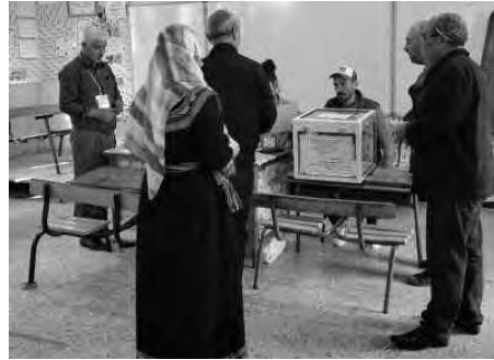
العملية الانتخابية إلى غاية نهايتها. وأكد رئيس السلطة الوطنية