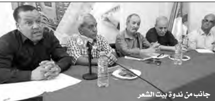
جانب من ندوة بيت الشعر