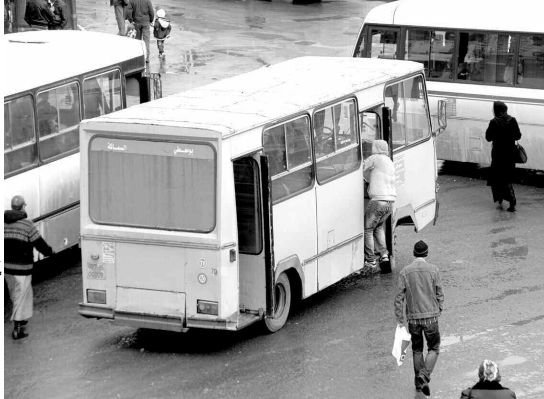
الناقلون يعملون بمنزلة في غياب سلطة الضبط