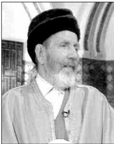
مما فضوه صحيح ويحاسب على ترك صلاته هذا والله أعلم، الشيخ أحمد حماني

- ما حكم الشرع في الشخص الذي يصوم ولا يصلي؟