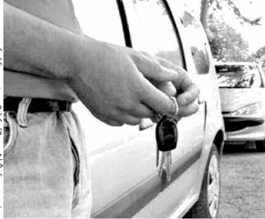
سائقو سيارات "الكولنديستان" يعرضون خدماتهم في الوقت المناسب

فرصة قلة وسائل النقل بعرض خدماتهم، لكن بأثمان باهظة، حسب أحد المسافرين الذي أكد لـ "المساء" أن أغليتهم يركنون مركباتهم بالقرب من محطات الحافلة خلال الفترات المسائية، ويفرضون مبالغ لا تقل عن 400 دينار، لمسافة قد لا تتجاوز الكيلومتريتين، ليبقى المسافرون بذلك الضحية الأولى، أمام صمت مديرية النقل عن كل التجاوزات التي بات يرتكبها الناقلون خلال شهر رمضان.