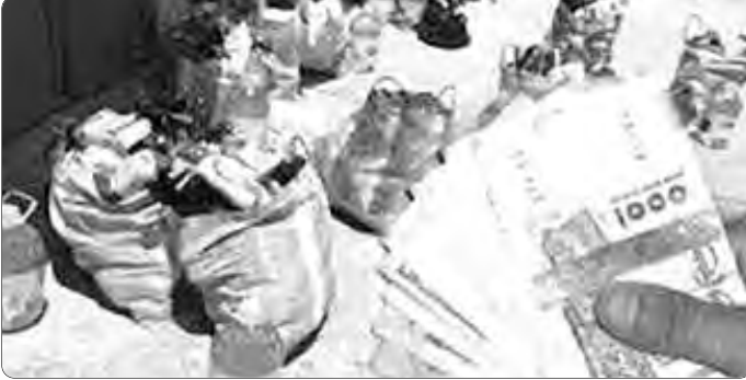
مواطنون معوزون لا علم لهم بمنحة رمضان

طالبات عملية توزيع قففة رمضان، التي كانت تعتمدها البلديات في إطار الإعانات التي كانت تخصصها الدولة للمواطنين المعوزين خلال شهر رمضان، عدة انتقادات، وذهب البعض إلى اتهام مصالح البلدية بالتلاعب بحق الفئات الهشة، ووصف تسيرها لهذا الملف بـ "الانتقائي" و "الشوائي"، وهو ما أدى بالجهات المعنية إلى اتخاذ قرار تخصيص منحة مالية تقدر بـ 10 آلاف دينار لكل أسرة لا يتجاوز دخلها الإجمالي 20 ألف دينار شهريا، وفقا للمراسلة التي أوفدها المكتب للصناديق الاجتماعية لولاية الجزائر، في 2019.