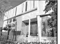
المكتبة الرئيسية لمطالعة العمومية عبد الرحمان بن حميدة

مختلف التخصصات في البحث عن تراث الجزائر، والتراث الإسلامي عموما. وتشمل المحاور كل ما يتعلق ببلاد زوارة في التقديم، في الوسائط، والحديث، والمعاصر؛ والوقائق من خلال الأرشيفية.