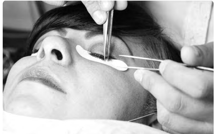
حملة تفتيش لصالونات التجميل والعناية الجسدية بوهران