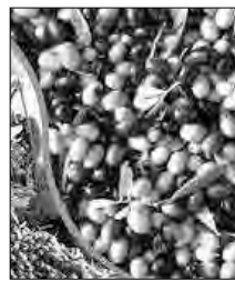
الفلاحة الماضية. تقدر المساحة الزراعية المخصصة لغرس أشجار الزيتون