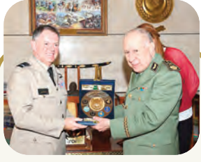
شقيقة يستقبل المستشار الأعلى للدفاع البريطاني

الجزائر - بريطانيا.. تعاون عسكري وأمني قريبا