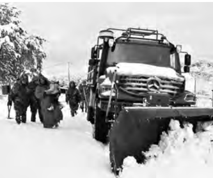
عمليات فتح الطرق التي لا تزال متواصلة اليوم، حيث تمسّ كل من الطريق الرابط بين بابور - جوادة الطريق الرابط بين بابور - أولاد لعربي، الطريق الرابط بين الشرفة - مشرفي، الشرفة الضمعة - تيمدين، وليبان - الشرفة - عموشة بولاية سطيف والطريق الولائي رقم 137 الرابط بين زمامة منصورية - إيراغن بولاية جيجل والطريق المؤدي لمنطقة الكاف لكل بولاية قسنطينة.

كما حذرت الثلوج خاصة ثانيا من استمرار تساقط للثلوج على المرتفعات التي يفوق علو 800 إلى 900متر، وسمك الثلوج يتراوح بين 10 و15سم إلى الساعة السادسة من صبيحة اليوم الأربعاء، والولايات المعنية هي كل من جنوب