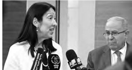
الرائدة في مجال السلم والأمن الدولي.

وإثبات هذه القضية، بهدف ضمان استقرار الصحراء الغربية والمنطقة بأسرها. بالإضافة إلى دعم عمل بعثة الأمم المتحدة لتنظيم استفتاء في الصحراء الغربية (مينورسو).