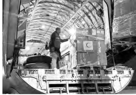
واحتلت الجزائر، الخميس، المرتبة الأولى من قبل منصة تنسيق للمجموعة الاستشارية الدولية

وتجند الهلال الأحمر الجزائري لتقديم الدعم اللازم للمنكوبين، بالإضافة إلى إشرافه على شحن المساعدات التي قدمتها الجزائر للبلدين حيث أرسلت هذه الهيئة فرقة إلى سوريا تتكون من 21 من 40 متطوعا ومتكونا في الإسعافات الأولية، وخصصت الجزائر طائرتها العسكرية لنقل المساعدات.