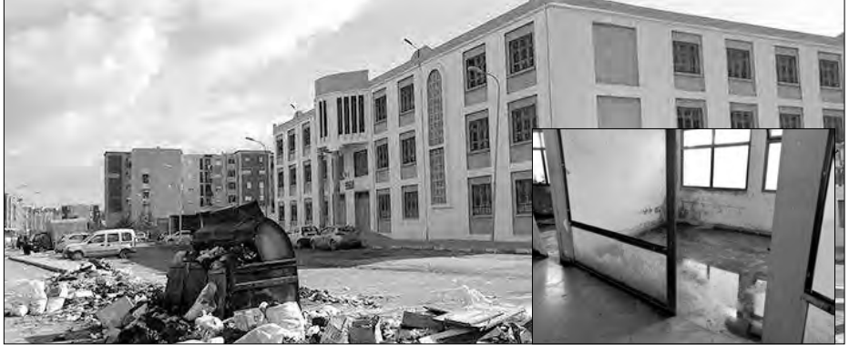
في جولة عبر أحياء مدينة الدويرة، غرب ولاية الجزائر، تمكنت "المساء" من الوقوف على عدة نقائص، أثرت على الإطار المعيشي للسكان، الذين اشتكوا وضعيتهم ويرغبون في توصيل انشغالهم للمسؤولين المحليين، من أجل التغاثة تنموية تخفف من متاعبهم.