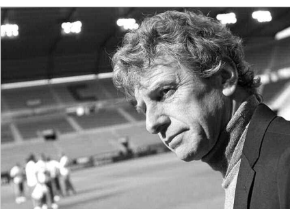
من الشهر القادم، حيث سيلتحق مباشرة من مالاوي، وقد يقدم للصفحة في 4 أو 5 أوت. كما سيجتمع برئيس الاتحادية الجزائرية لكرة القدم محمد دروادة من أجل التحدث عن الخطوط العريضة، والإمضاء على العقد الذي

مباشرة بعد ذلك، حيث تشير بعض المعلومات إلى أنه لن يكون حاضرا في الجزائر في مباراة نهائي الكأس الممتازة، التي ستعقب مولودية الجزائر باتحاد العاصمة في ملعب غوركوف سيحل في جديد بالجزائر نهاية شهر أوت الداخل، وهذا للتحضير للترميم الذي سيجريه الخضر تحسبا لمباراة إثيوبيا التصفية لكأس إفريقيا المقررة في أديس أبابا في 6 سبتمبر القادم، حيث سيلتقي المدرب الوطني لأول مرة بلاعبين الفريق الوطني، ليقدم لهم برنامج التحضيرات ويضبط بهم بالمناسبة التشكيلة التي ستواجه إثيوبيا. المنتخب الوطني المشاركين في مونديال البرازيل، الذي كلفه غوركوف بأن يسأل عن كل اللاعبين، وطالبهم بالعودة إلى التدريبات.