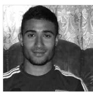
الفريق الوطني الجزائري في المستقبل القريب، لا سيما أن غوركوف يرغب في مواصلة النهج الذي سار عليه