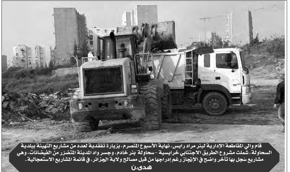
قام والي المقاطعة الإدارية ليثر مراد رايس، نهاية الأسبوع المنصرم، بزيارة تفقدية لعدد من مشاريع التهيئة ببلدية السحاولة، شملت مشروع الطريق الاجتيابي خرايسية - سحاولة بئر خادم، وجسر واد المدينة المتضرر من الفيضانات، وهي مشاريع سجل بها تأخر واضح في الإنجاز رغم إدراجها من قبل مصالح ولاية الجزائر، في قائمة المشاريع الاستعجالية.

مساء، معترضين لكل الأخطار، خاصة عند بقائهم في الشارع بعد خروجهم من المدرسة في الفترة الصباحية، وقبل العودة إليها على الواحد زوالا، فضلا عن المتاعب التي يواجهونها عند خروجهم مبكرا في فصل الشتاء، للوصول إلى المؤسسة التربوية باستعمال النقل المدرسي، وما يزيد من متاعب السكان