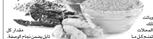
مقدار كل تابل يضمن نجاح الوصفة.

لتجربتها، مؤكدا أنها معادلة معاكسة، للبحث عن وصفة مناسبة للتابل وليس العكس، لا سيما ما يتعلق بالتوابل الأجنبية. ويقدّر ما باتت التوابل عاملا أساسيا في منح الأطباق أذواقا مختلفة، بقدر ما أصبحت المرأة تبحث عن الذوق الرفيع في تناقض مع نظيراتها؛ سواء في العائلة، أو العمل، ويات تلك المحلات تمنح كل ما