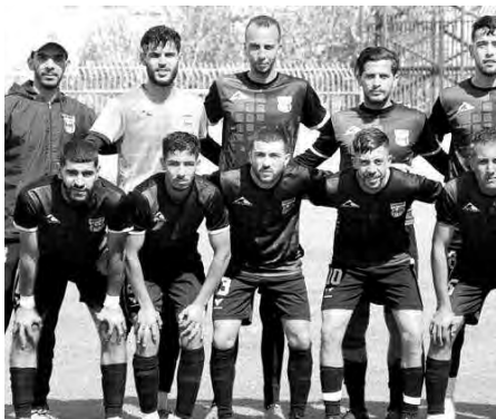
الذي يصارع هو كذلك من أجل البقاء، حيث يحتل الصف الرابع عشر، برصيد 26 نقطة، متأخرا بنقطتين فقط عن الوهرائيين، وفي الجولة 29،

حقق مديوني وهران الأهم، وفاز على شبيبة وفاق تالغ بنتيجة (1/2)، على ملعب "الحبيب بوعقل"، في مباراة كانت نقاطها لا تقبل القسمة على اثنين، نظرا للوضعية الحرجة التي يوجد فيها النادي الوهراني، والتي تتطلب انتفاضة لانقاذ الزي، قبل مغادرة قسم ما بين الرابطة (مجموعة الغرب)، وستكون سابقة في تاريخ مديوني، إن وقعت.