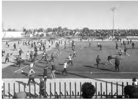
أنصار الفريق المحلي (المشرية)، والذي نتجت عنه فوضى عارمة، خلفت حالة من اللامن، وقد لجأ الحكام والمراقبون الذين هربوا من

سلطت لجنة الانضباط، التابعة للرابطة الوطنية لكرة القدم (هواة)، عقوبة بثلاث مباريات بدون جمهور، منها اشتان خارج الميدان على شبيبة المشرية، بسبب اجتياح الميدان، ورمي المقذوفات من طرف أنصار النادي، مما تسبب في إصابة رسمي المباراة التي جمعتها بترجي مستغانم، وتوقفها نهائيا قبل نهايتها، وكانت النتيجة لمستغانم (0-1)، حسبما أوضحته الهيئة الاتحادية المسيرة لكرة القدم للهواة.