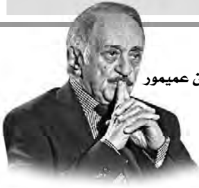
بقلم: الدكتور محيي الدين عيمور