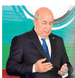
الجميع جميل الصبر والسلوان .. إن شاء الله

م . ب "سي عبد اللطيف"، حيث لشاد بالمسار الفضائي للمجاهد الراحل. وجاء في رسالة التعزية: شاء المولى عز وجل أن يتوفى الفقيه المرحوم المجاهد المدني حواس أحد أعلام إذاعة الجزائر الحرة، رفيق المرحوم المجاهد عيسى مسعودي وآخرين، الذين جاهدوا بالكلمة واستماتوا في إسراع صوت الثوار المجاهدين عبر أثر تلك الإذاعة المدوية إبان الكفاح المسلح. واستطرد الرئيس تبون: لقد كان الفقيه مثالا للوطنية والتزاهة والوفاء للجزائر في تلك المرحلة. وفي أداء المهام التي تولاهما بالتزام وطني وإخلاص عال في الإذاعة والتلفزيون بعد الاستقلال. وختم رئيس الجمهورية رسالته بالقول: "أمام هذا المصاب الأليم، أتوجه إلى عائلة الفقيه وإلى أسرة الإذاعة والتلفزيون والأسرة الإعلامية وإخوانه المجاهدين بأخلص التعازي وأصدق مشاعر المواساة، داعيا الله تبارك وتعالى أن يتغمده بواسع الرحمة والمغفرة، ويلهم الجميع جميل الصبر والسلوان .. إن شاء الله