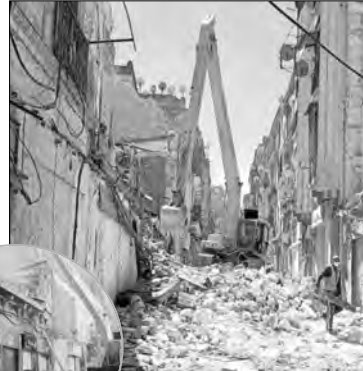
المسجلة في الخانة الحمراء السريع في بلدية وهران، والتدخل أي حالة

وقد سارعت مصالح الولاية إلى ترحيل العائلات، وهدم المبنيين، واستغلال العقارات المسترجعة لصالح المنفعة العامة.