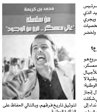
توثيق تاريخ فريقهم، وبالتالي الحفاظ على الذاكرة الوطنية.