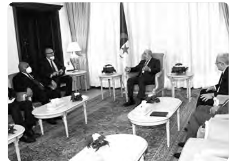
استقبال رئيس الجمهورية، عبد المجيد تبون، أمس بمقر الرئاسة رئيس برلمان جمهورية زيمبابوي جاكوب موديسا، الوطني، إبراهيم بوعالي ومدير ديوان

وأكد رئيس برلمان زيمبابوي، في تصريح عقب الأسبق على ضرورة رفع مستوى العلاقات السياسية والشراكة الاقتصادية التي تجمع بين الجزائر وبلاطه، مضيفا أن الرئيس تبون، أكد له "دعمه المستمر للشعب الزيمبابوي". كما أشار إلى أن رئيس الجمهورية، أكد له في هذا السياق أن "الجزائر مستعدة للعمل مع جمهورية زيمبابوي، خاصة في قطاعات التربية والاقتصاد". وأفاد في هذا الإطار أن الرئيس تبون، "حمله رسالة إلى نظيره الزيمبابوي" مفادها أنه كلف وزير الطاقة والمناجم للقيام بزيارة عمل إلى هذا البلد من أجل تطوير قطاع الطاقة وتعزيز التعاون في هذا المجال".