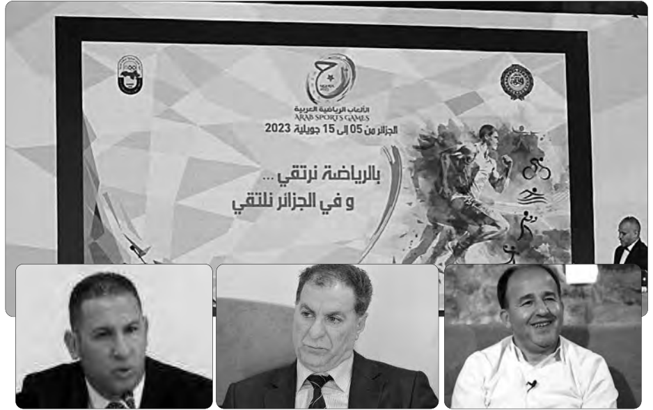
• خير الدين برباري