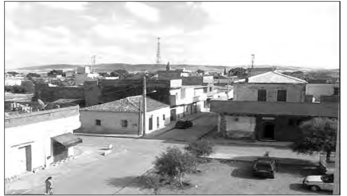
مسجد مهمل ويدون تأطير

أثار سكان القرية مشاكل أخرى، يتعلق بمسجد القرية، خالد بن الوليد، الذي يتواجد في حالة من الإهمال، بسبب غياب التأطير به، حيث عبر المشتكون عن تذمرهم من إهمال مديرية الشؤون الدينية والأوقاف في إيجاد حل للمسجد الوحيد، الذي يقصده المئات من المواطنين، وسط تقاعس الإدارة الوصية، وتركه دون تأطير، رغم عشرات المراسلات والشكاوى. أضاف سكان القرية، أن المسجد بات لا يؤدي دوره، بسبب حالة الإهمال واللامبالاة، حيث قالوا إن الصلوات يطؤها متطوعون فقط، ولا وجود لمن يديره ويؤطره، الأمر الذي جعل بعض الطفيليين، حسب شكوى المواطنين، يقومون بتسييره وفق أهوائهم، ليطالبوا خلال إيفاد لجنة التحقيق في الجيوب القارية المستورقة بقرية، وتسببت في حرمانهم من برنامج السكن الريفي الذي ينتظرونه لسنوات، من أجل تجسيد سكناتهم الريفية، وأكد المشتكون على ضرورة تهيئة ملفات البناء الريفي، خاصة أن الوعاء العقاري متوفر والمخططات جاهزة ومرفقة منذ أكثر من سنة في الرقم "أ" و"ج"، باعتبار أن قريته تضم تقريبا 250 قطعة، تم معاينتها من قبل الخبير وتحديد معالمها، من أجل البناء، غير أنه وإلى حد الساعة، لم يستفد أي شخص منها في إطار البناء الريفي.