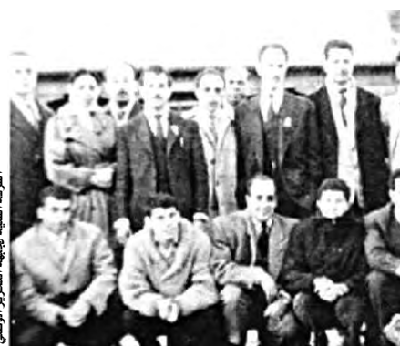
الفرقة الفنية لجبهة التحرير الوطني