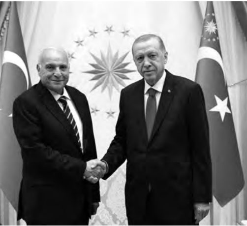
التطرق أيضا إلى مستجدات الأوضاع في منطقة الساحل الصحراوي التي تشكل محل اهتمام متبادل ومصدر لانشغال متزايد لدى البلدين ولدى المجموعة الدولية

وطالب الرئيس أردوغان من الوزير أحمد عطاف في ختام اللقاء، نقل تحياته الخالصة لأخيه الرئيس عبد المجيد تبون وتطلعه للقاء به عن قريب ومواصلة العمل معه على درب تعزيز العلاقات الجزائرية-التركية في ظل الثقة التامة والتطلعات الدائمة والطموحة.