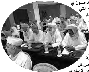
أجمع المتدخلون في الندوة الدينية التي احتضنتها دار الثقافة مالك حداد بقسطنطينية، مؤخرًا تزامنا والاحتفال باليوم الوطني للإمام المصنف لـ 15 سبتمبر من كل سنة، على دور الإمام في

تنوير المجتمع، وتعميم قواعد المرجعية الدينية، وتعزيز الهوية الوطنية، إذ أكدوا أن الإمام يؤدي دورا بارزا في المساهمة والحفاظ على الأمن الروحي والاجتماعي والعائلي؛ باعتباره القلب النابض للمجتمع المسلم، منكرين بالدور المحوري لهذا الأخير، ومهمته النبيلة في تبليغ الرسالة النبوية، وتوريثها للأجيال القادمة؛ بهدف مجابهة مختلف التحديات الخطيرة التي تواجه المجتمع الجزائري. وتؤكد المشاركون في الندوة من أئمة وأساتذة تعليم قرآني، بالدور الريادي الذي يؤديه الإمام داخل المسجد وخارجه في سبيل صون قيم وأخلاق المجتمع، ومواكبة التحديات المعاصرة التي تواجه المجتمع؛ حيث إن الإمام لا زال يعمل على الترشيد والتوجيه للمحافظة على وجهة هذه الأمة في دينها ولغتها وتاريخها، فهذه الفئة كانت ولا زالت منذ الثورة التحريرية إلى غاية الساعة، تصارع الهزات والمكائد التي تحاك من قبل المتمرصين بالدولة.