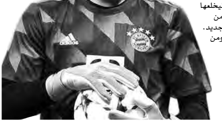
غوارديولا لشبكة "بي بي سي":

جانبه، قال هامان عبر شبكة "سكاي الألمانية": "لديك لاعب يحمل شارة القيادة في تلك اللحظة، ولا يعرف أنه سيلعب لمدة 60 دقيقة فقط.. هذا كارثي بالنسبة للصورة العامة". وأضاف: "لديك الكثير من المدربين المساعدين وأخصائيي العلاج الطبيعي، يجب على شخص واحد على الأقل، الذهاب إليه، وإخباره بذلك". وأتم: "بعدما أطلق توخيل تصريحاته قبل بضعة أسابيع بعدم ثقته في لعب كيميشتش كارتكاز، بالأمس كانت هناك واقعة أخرى بمثابة زينة على الكعكة، وهو ما يؤثر على حضور اللاعب وسسلته داخل غرفة الملابس".