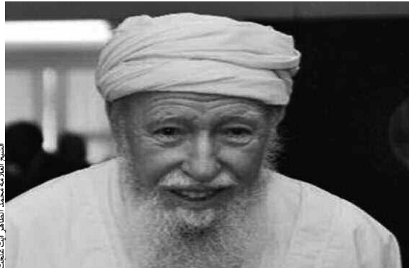
الشيخ العلامة محمد الطاهر أيت علجت

ظهرت في الآونة الأخيرة المراهقة الدينية لبعض الشباب المتخرجين حديثاً من كليات الشريعة، يتصدون للفتوى، بعضهم يتشدّد وبعضهم يتساهل، فما قول العلماء في هذا الاجترار؟ الشيخ العلامة محمد الطاهر أيت علجت أوضح لنا قائلا: أنه يحلو لبعض طلبة العلم، ممن أدرك طرّفاً من العلم أو حصل على شهادة من كليات الشريعة أن يصدر الفتاوى والأحكام مبنياً وشاملاً، ولا يُسأل عن صغيرة ولا كبيرة، إلا قال: هذا حلال وهذا حرام، وهذا منكّر، وهذا فاسق، وهذا كافر، وهذا مبتدع، وإصدار أحكام الردة والكفر خاصة أسهل ما يجري على لسانه، ولا يدري المسكين أن هذه الكلمة التي لم يلق لها بالا قد تهوي به في نار جهنم سبعين خريفاً، كما قال النبي.