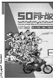
شاعرة سيمين بهباني

وقالت بهباني للخدمة الفرنسية في «بي بي سي» عام 2012: «حتى الآن قلت ما كان ينبغي أن أقوله، لقد قلت دائماً أنني ضد الموت وأتني ضد القتل وضد الحبس».