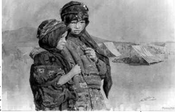
من إبداعات الفن التشكيلي العربي

ورصد المشاركون في الندوة هموم حرية الإبداع من خلال تقديم نماذج من مختلف الدول العربية، حسب الانتماء الجغرافي لكل مشارك، ونافشوا المشكلات التي يواجهها المبدع العربي في ظل الأوضاع السياسية المضطربة في المنطقة العربية.