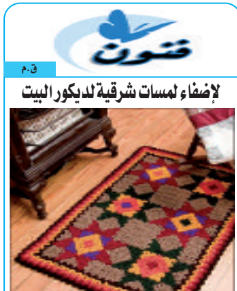
إضاءة لمسات شرقية لديكور البيت

وهكذا لم تعد القبعات التي يزداد الطلب عليها مع كل موسم صيف من قبل مختلف الشرائح الاجتماعية والفئات العمرية مجرد أكسسوار أو مظهر للأنثى وإنما وسيلة ضرورية