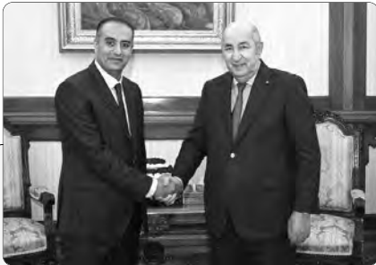
استقبل الرئيس الجديد للاتحاد الجزائري لكرة القدم وليد صادي

■ حرق بعض المتطرفين للمصحف الشريف استفزاز لمشاعر المسلمين ■ مطالبون باتخاذ إجراءات تمنع التفكير في هذه السلوكيات مستقبلاً