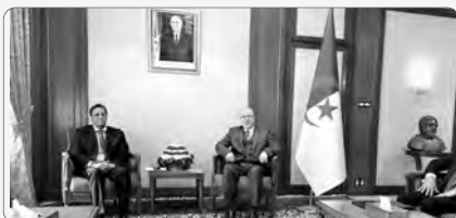
استقبل الوزير الأول، أيمن بن عبد الرحمان، أمس، بقصر الحكومة، وودادي ولد سيدي هيبه، سفير موريتانيا بالجزائر، الذي أدى له زيارة ودية على إثر انتهاء مهامه بالجزائر.

الوزير الأول يستقبل سفير موريتانيا لدى الجزائر تأكيد جزائري - موريتاني على ترقية المبادلات التجارية