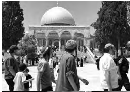
خالص للمسلمين تحت الوصاية الأردنية

وكانت الأمم المتحدة في طليعة عديد الجهود الدبلوماسية الرئيسية لتعزيز نزع السلاح النووي، حيث أقرت الجمعية العامة في 1959، حيث أقرت السلاح العام الكامل. وفي 1978، أقرت الدورة الاستثنائية الأولى للجمعية العامة المكرسة لنزع السلاح كذلك بأن نزع السلاح النووي ينبغي أن يكون الهدف الأولوية في مجال نزع السلاح وقد عمل كل أمين عام للأمم المتحدة بنشاط على تعزيز هذا الهدف.