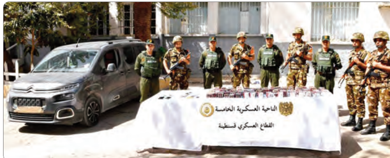
القناطر العسكرية الخامسة

شخصا آخر وضبط 3 مسمدسات رشاشة من نوع كلاشينكوف و27 بندقية صيد و170 قنطار من مادة التبغ و336851 وحدة من مختلف الألعاب النارية، وهذا خلال عمليات متفرقة عبر التراب الوطني. كما أحبط حراس الحدود، بالتنسيق مع مصالح الدرك الوطني والجمارك، محاولات تهريب كميات من القودو تقدر بـ 32582 لتر بكل من برج باجي مختار وتبسة وسوق أهراس والطارف. من جهة أخرى، أوقفت مفارز مشتركة للجيش الوطني الشعبي 562 مهاجر غير شرعي من جنسيات مختلفة عبر التراب الوطني.