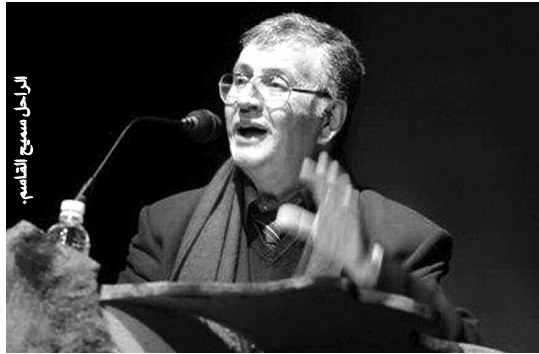
الرجل سميح القاسم

وحده سميح القاسم وقف كأشجار الزيتون صلباً محافظاً على هويته ولسانه وروحه عربياً بين الأعاجم الجدد، بل مجد للعبية مرتقياً بها بشعره ونثره، وقد عرفنا سميح القاسم شاعراً وما هي رائته من روائع نثره الحدائي يرتقي فيها بالرواية لغةً وفناً ليهدي "إلى الجحيم أيها اليليك".