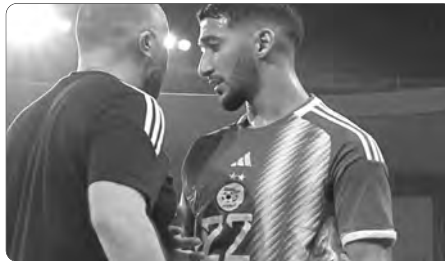
مخطئا تماما في رد فعله". ويتوقع كثير من المتابعين أن تنتهي قصة بن رحمة مع "الخضر"، بسبب هذه الحادثة، ولعدم نجاحه في تثبيت أقدامه داخل التشكيلة الأساسية

عصيب أثناء تواجده في معسكر المنتخب الجزائري؛ أولا تعرض لحادثة محرقة مع إسلام سليمان؛ لمحاولة تنفيذ ركلة جزاء خلال فوز الجزائر 1-5 على الرأس الأخضر، قبل أن يصطدم بمدربه في ودية مصر، قبل أن يهاجم الموقع الإنجليزي تصرف بلماضي، قائلا: "كان لاعب هامز غير فعال بكل إنصاف، قبل أن يقرر جمال بلماضي استبداله، ولا حرج في هذا القرار بالطبع، لكن ما لم يكن مطلوباً على الإطلاق، هو الطريقة التي تعامل بها بلماضي مع مهاجم وستهام عندما غادر الملعب؛ إنه تصرف غير مقبول، وغير مبرر". وزاد كاتب المقال: "إن الاشتباك بين بن رحمة والمدير الفني الجزائري، كان شيئا لم أره من قبل؛ لقد كان بلماضي