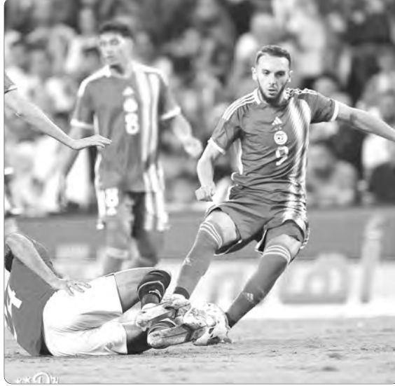
القرارات التحكيمية. بعيدا عن تلك الأخطاء من عدمها، فإن تكرار بلماضي هذه التصرفات، حسب المحللين، يؤثر بشكل مباشر، على تركيز لاعبيه على أرض الملعب، ويجعلهم يتصرفون مثله تماما؛ الأمر الذي قد يعرضهم للحصول على إنذارات

أكد العديد من المحللين عند حديثهم عن مخلفات ودية الجزائر ومصر (1-1)، تفوق مدرب "الفراعنة"، البرتغالي روي فيثوريا تكتيكيا، على جمال بلماضي، وعلى وجه التحديد منذ طرد مدافعه محمد هاني في الدقيقة 26 من اللقاء، حيث نجح في إغلاق كل المساحات على زملاء رياض محرز، وأجبرهم على الاكتفاء بالتمريرات العرضية بدون تشكيل أي خطورة على مرمى الحارس الشناوي إلا في الأنفاس الأخيرة من اللقاء، عندما نال الثعب من المصري.