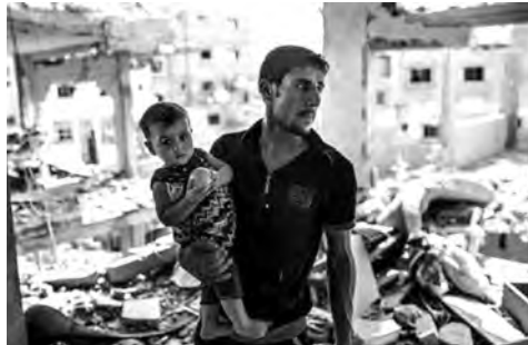
الاستهداف المتكرر لمحيطة.

وأعلنت أيضاً أن مقاومتها خاضوا اشتباكات عنيفة استخدمت فيها الأسلحة الرشاشة وقذائف الياسين 150 مع قوات الاحتلال المتوعدة شمال غرب غزة، في حين باغت عناصر أخرى قوات الاحتلال المتوعدة شمال غرب بيت لاهيا وهاجموها بقذائف الياسين 105 والأسلحة الرشاشة تحت غطاء من أسلحة القنص، وبالمقابل دوت صافرات الإنذار في القدس المحتلة خلال تشييع جثمان جندي قتل أول أمس، عندما انقلبت دبابة في شمال فلسطين المحتلة. وردا على فشله في تنفيذ توغلات حتى لو كانت محدودة في قطاع غزة، أقدم طيران الاحتلال أس على قصف مستودعات الإمداد الأحمر الفلسطيني في غزة بما تسبب في أضرار كبيرة بالمخازن.