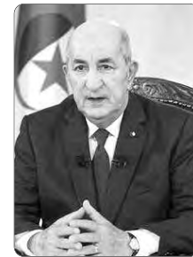
أفضل المستويات في معدلات التنمية الاقتصادية والاجتماعية، عبر تسخير الإمكانيات وتجنيد الطاقات ومعارية التقاسع، والتحرر من العراقيل والذهنيات البيروقراطية. وبعد أن أشار إلى أن ذكرى غزة نوفمبر المجيد تجعلنا نستشعر على الدوام ثقل

المسؤولية وقداسة الأمانة، شدد السيد الرئيس على أن هذه المسؤولية الثقيلة، نستمد منها "الإرادة القوية للوصول بفضل جند المواطنين والوطنين إلى أهدافنا الاستراتيجية التي حرصنا وسنظل نحرص على الاحكام فيها في الحقائق في الميدان، بعيدا عن سقطات منابر البهتان والمزايدة وعن الصخب الدعايني الصادر عن المصطفين في طواير المعادين لبلادنا الغالية، وهي تستشرف بكل عزم وبثبات عهد النماء والرخاء، ووفاء لما سطره شهداؤنا الأبطال طيب الله ثراهم... وفي حين سجل بلان مناسبة هذه الذكرى الخالدة، تأتي هذه السنة، "مترامنة مع التداعيات الخطيرة لتنامي الاحتلال الصهيوني في عدوانه السافر على الشعب الفلسطيني واستمراره في اقتراح جرائم الإبادة المتكررة في قطاع غزة". أكد الرئيس تبون أن الجزائر التي كانت دائما إلى جانب الشعب الفلسطيني قولا وفعلا، وفي الوقت الذي تجدد فيه دعوتها لكل