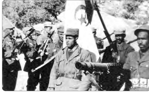
القتلى: "أعلنوا طائراكم منكم قفنا".

تحية الجزائر اليوم الذكرى الـ69 لثورة الفاتح من نوفمبر المجيدة التي قدمت للإنسانية، أروع الأمثلة في التضحية، وأصبحت نموذجا في الكفاح ضد قوى الاستعمار والظلم عبر العالم.