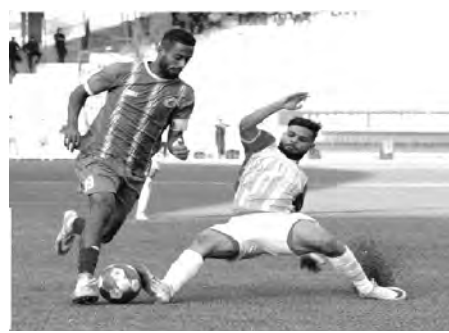
وكانت هذه المواجهة مقررة أن تلعب يوم 1 ديسمبر الجاري بتيموشت، لحساب الجولة

وعشية الجولة الثامنة، يتصدر فريق ترجي مستغانم الترتيب بـ 17 نقطة، متبوعا برائد القبة (16) في الصف الثاني.