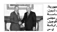
استقبل رئيس الجمهورية، السيد عبد المجيد تبون، أمس، بمقر رئاسة الجمهورية، رئيس مجلس الأمة السيد صالح قوجيل، حسبما أورد بيان لرئاسة الجمهورية.

ترأس الوزير الأول، نذير العريايوي، أمس، اجتماعا للحكومة تناول مشاريع مراسيم تنفيذية تخص عدة قطاعات، على رأسها مشروع المرسوم التنفيذي الذي يحدد تنظيم سير الوكالة الوطنية للعقار الحضري. وأوضح بيان لصالح الوزير الأول، أن هذا الاجتماع تناول على وجه الخصوص مشروع المرسوم التنفيذي الذي يحدد تنظيم سير الوكالة الوطنية للعقار الحضري، وذلك تنفيذا لتعليمات السيد رئيس الجمهورية، المتعلقة باستكمال إصدار المراسيم التنفيذية الخاصة بالاعتراف الاقتصادي الموجهة لإيجاز مشاريع استثمارية وتنمية الاقتصاد الوطني.