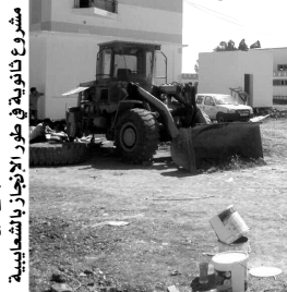
مشروع ثانوية في طور الإنجاز بالثانوية