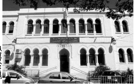
مقر بلدية أولاد الشبل

ومن خلال زيارة قامت بها "المساء" إلى البلديات التي استقبلت عددا كبيرا من السكان في أضخم عملية ترحيل، ونخص بالذكر حيي "3150 مسكنا" بأولاد الشبل و"2200 مسكنا" بسيدي محمد بنر توتة، للاطلاع على واقع الهياكل التربوية، يتبين أن ولاية الجزائر، رغم الجهود المبذولة من طرف الوصاية، لم تقض على العجز المسجل في المنشآت التربوية، لاسيما بالطور الثانوي. ونستشف من خلال ما صرح به المسؤولين المحليين أن الجهات الوصية ركزت بالخصوص على توفير هياكل الطورين الابتدائي والمتوسط، ليبقى تلاميذ الثانويات أكثر حاجة إلى هياكل كافية وقريبة من أحيائهم السكنية.