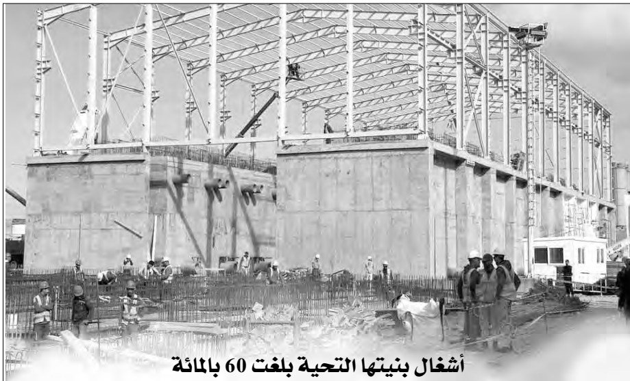
أشغال بنيتها التحتية بلغت 60 بالمائة

قرار والي معسكر التكاليف بمتوسطة عبد الحميد بن باديس يعين الكحلة من خلال طرح فكرة أخرى جديدة، لفتي أن إقبالها من قبل سكان الماسونية، سيما من قبل الطاقم التربوي المسؤول عن تعليم ومراقبة 733 تلميذ يلتحقون بالموسسة يوميا من مختلف أنحاء البلدية.