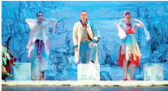
مشهد من مسرحية "ليلة إعدام"

الموسم، أي مدينتي وهران وبوردو. كما يهدف المشروع إلى توسيع التوعية لتمد إلى الجامعيين، من خلال الدورات التكوينية وشهادة الماستر التي يحصل عليها المتابعون لهذا المشروع. وتقدم الدورة المطلقة مؤخرًا 10 أيام بغير الجمعية بوبران كمرحلة أولى، ثم يتم الانتقال إلى مدينة بوردو يوم 7 سبتمبر إلى غاية 14 من نفس الشهر بجامعة ميشال دومونتاني "بوردو".