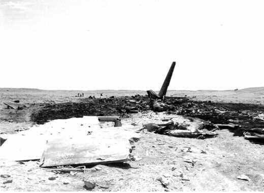
حطام الطائرة الأوكرانية

الأسكتلندية باتجاه مالابو بفنغيا الاستوائية، وقامت خلالها بعدة توقفات تقنية منها توقف بمطار غرداية وآخر بتمنراست، قبل أن تنتهي رحلتها نهائيا إثر سقوطها دقائق قليلة بعد إقلاعها من مطار تمنراست. وقام المركز الجهوي للمراقبة الجوية الكائن بالجزائر العاصمة، بإصدار رسالة إنذار عن اختفاء الطائرة مباشرة بعد فقدان الاتصال بها، ملنا حلة الطوارئ والتأهب لدى مصالح البحث والإنقاذ التي استقرت فورها المتواجدة على مستوى مطار تمنراست، كما قام والي تمنراست، بتشكيل خلية أزمة محلية مشكلة من عدة قطاعات، مع تكليف فرق البحث والإغاثة بالخروج للبحث عن الطائرة المفقودة، التي تم العثور على حطامها على بعد 15 كلم جنوب المطار بمنطقة جبلية تعرف بـ "تفرمبات" وتقع على مسافة 25 كلم من مدينة تمنراست، فيما تم تأكيد وفاة طاقم الطائرة، وتحديد جنسيات أفراد وهم 6 أوكرانيين وروسي واحد، وذلك بالموازاة مع انطلاق عمليات البحث عن المسندوقين الأسويدين بمشاركات أفراد من الجيش الوطني الشعبي ومصالح الحماية المدنية.