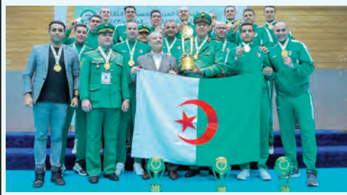
حل، صبيحة أمس، بإرض الوطن، المنتخب الوطني العسكري الجزائري للكرة الطائرة، قادما من المملكة العربية السعودية، بعد تشريفه الراية الوطنية بحصوله على الميدالية الذهبية للبطولة العربية العسكرية الثالثة للاتحاد العربي للرياضة العسكرية، التي أقيمت في الفترة الممتدة من 17 إلى 24 ديسمبر 2023.

وأوضح البيان أن ممثلي عائلات الجالية الوطنية المتواجدة بغزة أعربوا خلال اللقاء عن قلقهم من الأوضاع والمخاطر الناجمة عن الاعتداءات الهمجية لقوات الاحتلال الصهيونية، مشيرا إلى أن المدير العام للشؤون القنصلية والجنالية الوطنية بالخارج أكد خلال هذا اللقاء، أنه تم اتخاذ جميع الإجراءات والترتيبات اللازمة للقيام بعملية الإجلاء في أحسن