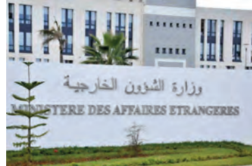
الظروف، "تنفيذا لتعليمات السلطات العليا ببلادنا التي تولي أهمية بالغة لمتابعة وضعية جالياتنا بغزة".

كما طمأن ذات المسؤول بالمناسبة، وفقا للبيان، بأنه "يتم متابعة وضعية جالياتنا بغزة عن كثب، حيث تمّ اتخاذ جميع الإجراءات والترتيبات اللازمة على مستوى وزارة الشؤون الخارجية بالتنسيق مع سفارة الجزائر بالقاهرة، من أجل مباشرة عملية الإجلاء فور الحصول على تراخيص العبور عن طريق منفذ رفح من قبل السلطات المصرية".