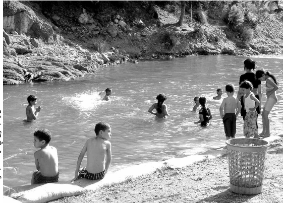
الأطفال يسبحون في مياه عذبة وداقة