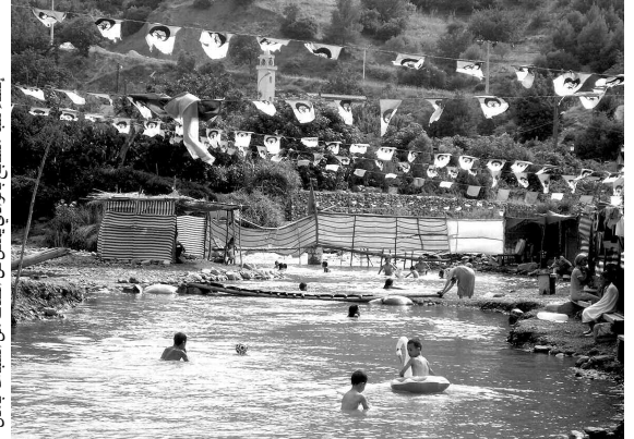
إنشاء شبه مساح بالوادي يمكن كل الفئات من السباحة بأمان

بواسطة الحجارة وترك فتحات صغيرة من أجل مرور الماء، بهدف تمكين الزوار، خاصة الأطفال، من السباحة، وعلى أطرافه تم وضع مخيمات للعائلات للجلوس داخلها ووقايتها من حر الشمس، ويتم كراؤها مقابل مبلغ 400 دج للخمسة الواحدة ليوم واحد، بالإضافة إلى تنظيم حظائر السيارات بالمكان، حيث يتكفل بها شباب المنطقة مقابل مبلغ 50 دج، فيها خصصت أماكن أخرى على ضفاف الوادي لغسل السيارات مقابل نفس المبلغ.