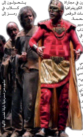
مشهد من مسرحية «ليلة غضب الآلهة»

وتتميز مسرحية «ليلة غضب» إلى المسرح التجريبي، وتعتبر أول عمل