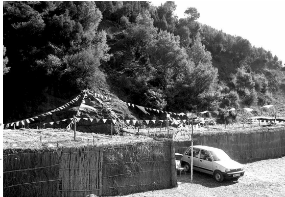
مخيمات خاتمة للعائلات