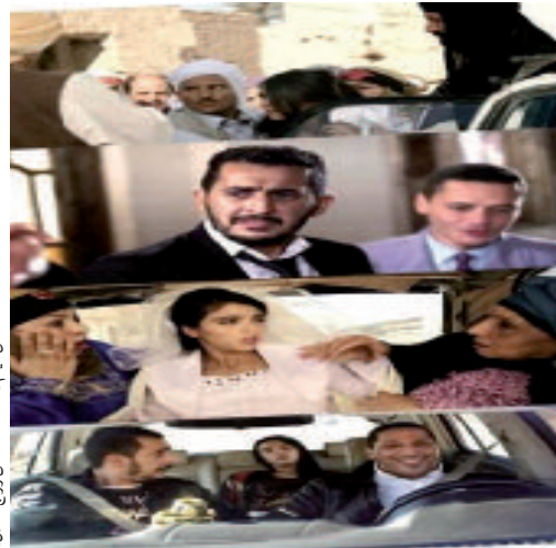
أحداث الفيلم «المصادقة على زواج حلال» لعمود زموري

يذكر أن المهرجان الذي تأسس سنة 2005 ويختص بعرض آخر إنتاجات السينما العربية، يمنح جائزة الجمهور لأحسن فيلم، وهي الجائزة الكبرى التي سبق أن فازت بها المخرجة الجزائرية صافيناز بوضيعة عام 2012 عن وثائقها «الغوسطو».