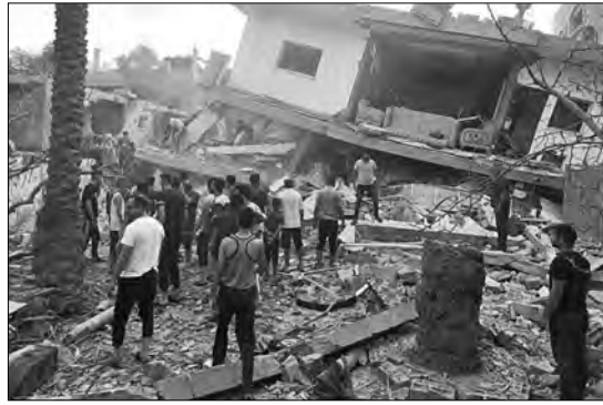
أسامة مدينة دورا بالكيانات العسكرية ودارت مواجهات أطلقت خلالها الرصاص الحي والمعدني المغلف بقنابل وقنابل الصوت والغاز السام صوب المواطنين الفلسطينيين بما أدى لاستشهاد الشاب والفتاة وإصابة آخرين.

بتنفس الوتيرة المتسارعة والتصعيد العنيف يواصل الكيان الصهيوني قصفه الوحشي للشهر الرابع على التوالي على قطاع غزة مخلفا سقوط مزيدا من الضحايا بين شهداء وجرحى ومفقودين تحت الأنقاض ودمار واسع وهائل تكشف هولته بعد انسحاب الآليات العسكرية الصهيونية من عدة مناطق في القطاع المنكوب.