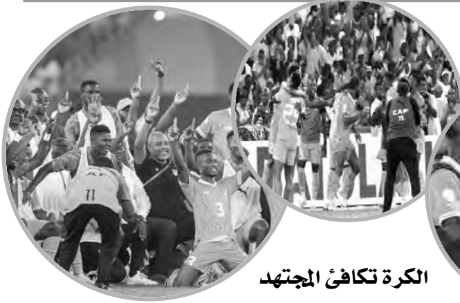
الكرة تكافئ المجتهد