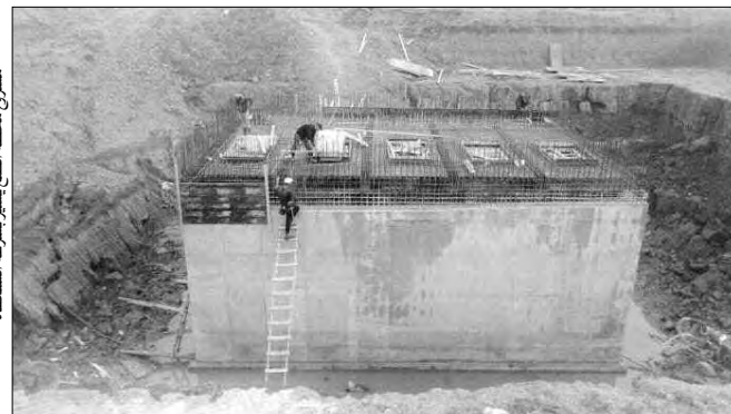
مشروع محطة الضخ ببلدية تسالة المرجة

مازالت عدة أحياء ببلدية تسالة المرجة بالعاصمة، تواجه مشكل الفيضانات؛ إذ تتعقد وضعيتها خلال الأيام المطيرة. ويتوجس السكان خيفة كلما أطلق ديوان الأرصاد الجوية نشرة خاصة، والسبب، حسبهم، هو غياب قنوات صرف مياه الأمطار والصرف الصحي، وما هو موجود من القنوات الضيقة وغير المدروسة، والتي لا تضي بالفرص المطلوب، بل تزيد في تعقيد الوضع البيئي، إلى جانب نقص خدمات النقل، التي أرغمت الأولياء بالأحياء المعزولة، على توقيف أنبائهم عن الدراسة.