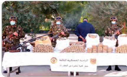
الاجتماعية القاهرة وغلاء المعيشة وتفتش الفقر والبطالة تدفع بالشباب المغربي إلى تهريب المخدرات نحو الجزائر. مستعرضا الوضع المعيشي المزري في ظل نقص مادة الغاز وارتفاع سعرها. وأكد في ختام اعترافاته أن نظام المخزن يقوم بإسكات واضطهاد

الشعب المغربي واعتقل كل المندوبين بالتطبيع مع الكيان الصهيوني. وقال بهذا الخصوص لا أحد منا يعترف بالتطبيع مع الصهيونية، ونحن بدورنا ببوعرفة خرجنا للشارع من أجل التظاهر والتعبير عن رفضنا لذلك، حيث تعرضنا للضرب وعضنا للسجن. وأضاف: يوجد من بين جبراني ضباط في صفوف الجيش الملكي أكلوا أنهم ضد هذا التطبيع، وسيهيرون لو أتيحت لهم الفرصة لذلك. للتذكير، تم توقيف المهرب المغربي مؤخرا ببشار، في عملية نوعية قامت بها مفاز للجيش الوطني الشعبي وبحوزته 207 كلغ من الكيف المعالج وسلاح ناري.