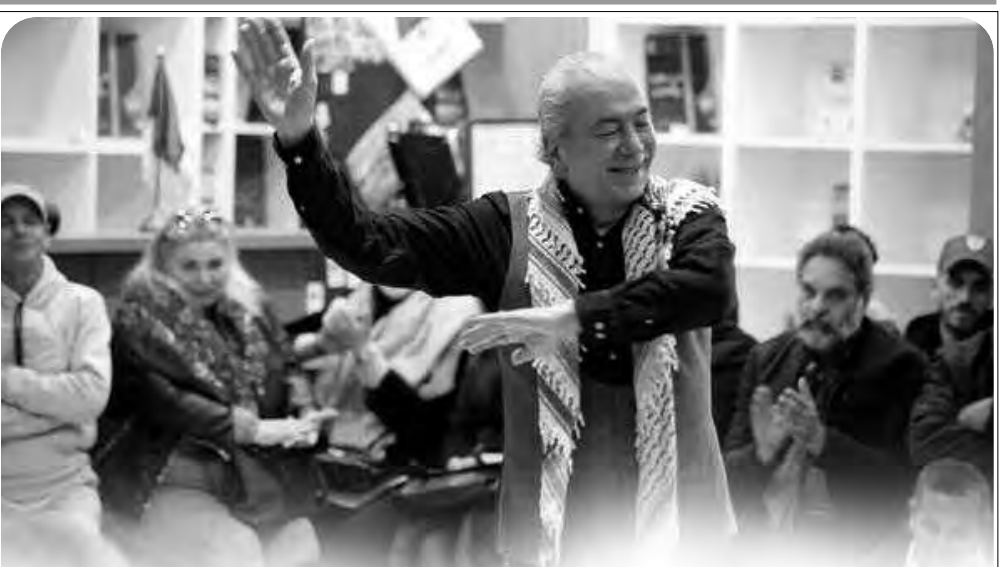
الأديب الإيطالي إيتالو كالفينو، الذي كتب نصوصا ناهض فيها المستعمر الفرنسي بالجزائر، وشبهه ممارسته التعذيب بالأرهاب.

ومثلت بداية تعاون بين الوكالة والمعهد الإيطالي بالجزائر، في انتظار تنظيم نشاطات أخرى، وفي حين نوهت