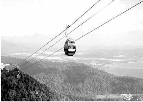
حلول دون عرض طبيعتها والتي تمت للتذكير، فإن المشروع الذي يمتد على مسافة 5.4 كلم يضم 120 عربة 66 مواضيع إنجاز مختلف المحطات التي

يواجه مشروع إنجاز النقل بالعربات الهوائية "التلفريك" بولاية تيزي وزو، جملة من العقبات التي عرقلت مسار الخط، حيث تسعى مديرية النقل للولاية لحل وتجاوز كل العراقيل التي قد تؤدي إلى تأخر مواعيد استلام هذا المشروع الذي يرتقبه سكان تيزي وزو بفارغ الصبر ليعزز إمكانيات ووسائل النقل بالولاية.