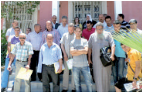
أعضاء جمعية ترقية المعوق