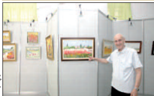
الضمان في معرضه.

معرفة التغيرات الكبرى التي ستحدث مثل البحث عن العنقاء العصفور الأسطوري لأجل الحصول على سر الخلود وميلاد جيش لا يقهر.