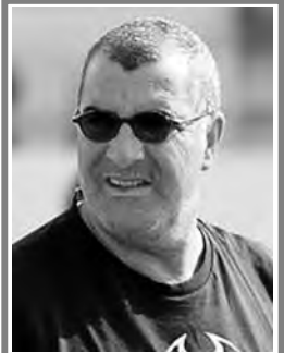
أشاد بلاعبييه عقب الفوز أمام "الكناري"