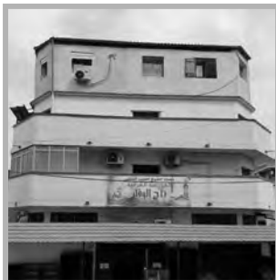
جهود الخيرين حولت مصلى إلى قلعة دينية بامتياز