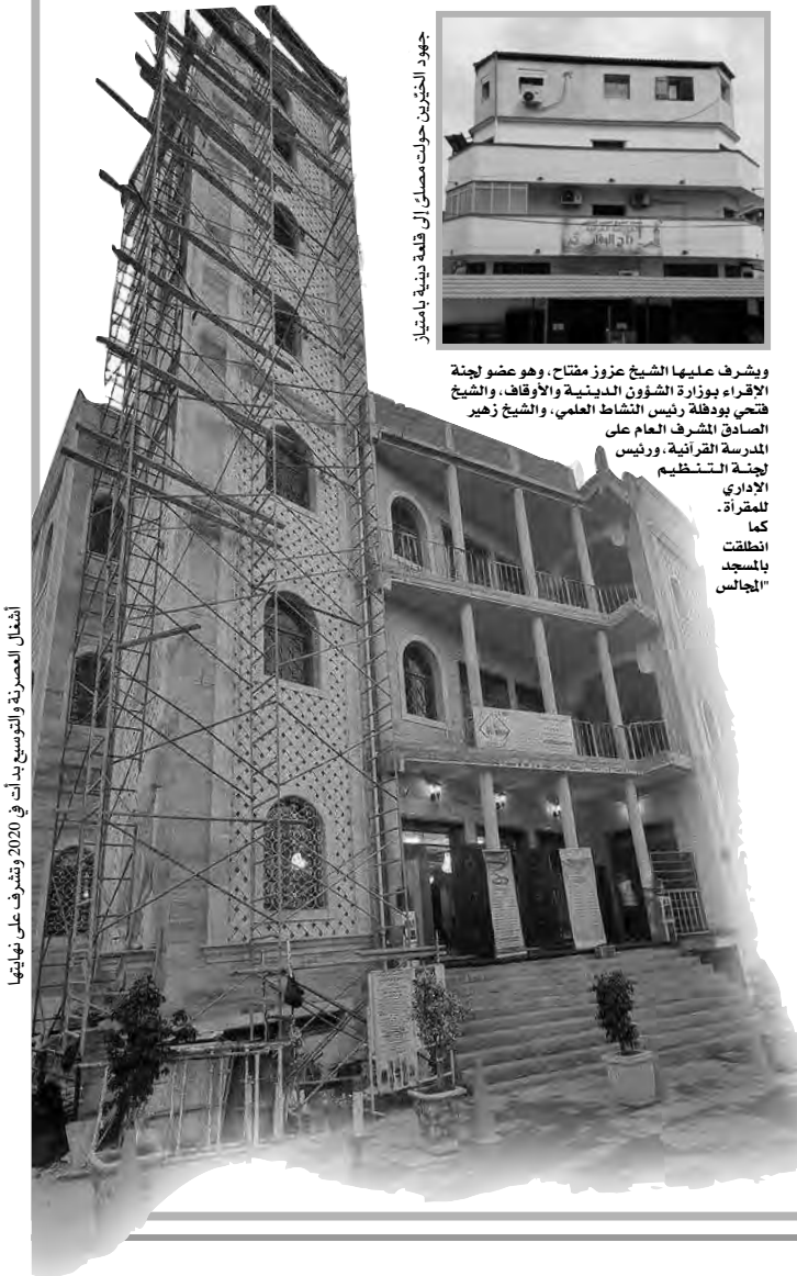
أشغال العصرية والتوسيع بدأت في 2020 وتشرف على نهايتها